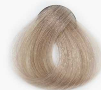
901 Ice Blonde بلوند یخی فوق العاده روشن