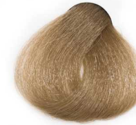
8/003 Light Warm Natural Blonde بلوند طبیعی گرم روشن