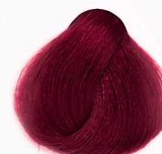
5/6 Cherry Red قرمز گیلابی