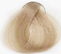
11/23 Aprikat Super Platinum سوپر پلاتینه آپریکات