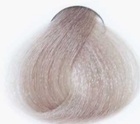
11/2 Oyster مدفی