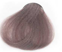
8/01 Light Ash Blonde بلوند خاکستری روشن