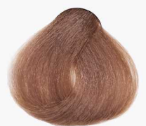
7/75 Medium Chestnut Blonde بلوند فندقی متوسط