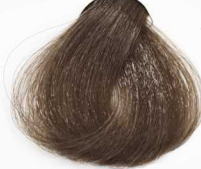
6/7 Dark Chocolate Blonde بلوند شکلاتی تیره