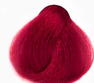
7/66 Fire Red قرمز آتشین