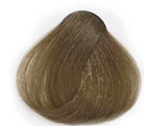
7/8 Medium Matt Blonde بلوند زیتونی متوسط