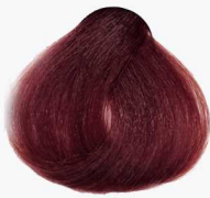
6/5 Dark Mahogany Blonde بلوند ماهگونی تیره