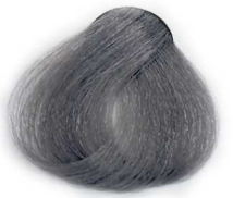
9/1 Extra Light Smoky Blonde بلوند دودی خیلی روشن