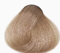
8/23 Light Aprikat Blonde بلوند آپریکات روشن