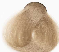
9/7 Very Light Chocolate Blonde بلوند شکلاتی خیلی روشن