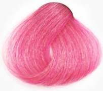
PL Pink Lavender لوندر