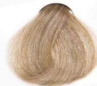
9/3 Very Light Golden Blonde بلوند طلایی خیلی روشن