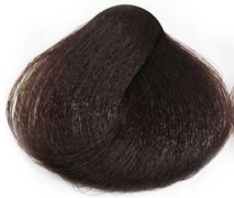
3/0 Dark Brown قهوه ای تیره