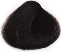
1/0 Black مشکی