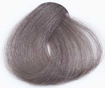
7/21 Medium Pearl Blonde بلوند مرواریدی متوسط