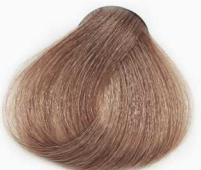
7/31 Medium Beige Blonde بلوند بژ متوسط