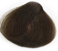
4/8 Medium Matt Brown قهوه ای زیتونی متوسط