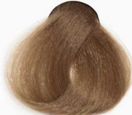
7/7 Medium Chocolate Blonde بلوند شکلاتی متوسط