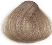
9/0 Extra Light Blonde بلوند خیلی روشن