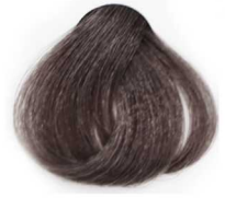
8/11 Intensive Light Smoky Blonde بلوند دودی قوی روشن