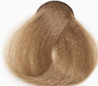
8/7 Light Chocolate Blonde بلوند شکلاتی روشن