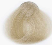
11/7 Chocolate Super Platinum سوپر پلاتینه شکلاتی