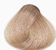
9/23 Very Light Aprikat Blonde بلوند آپریکات خیلی روشن