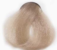
9/31 Very Light Beige Blonde بلوند بژ خیلی روشن