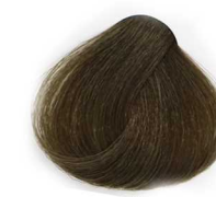
5/8 Light Matt Brown قهوه ای زیتونی روشن