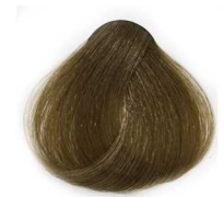
6/8 Dark Matt Blonde بلوند زیتونی تیره