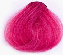
PM Magenta مژتا