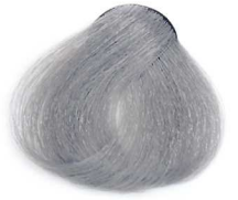
10/1 Platinum Smoky Blonde بلوند دودی پلاتینه