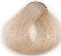
10/0 Platinum Blonde بلوند پلاتینه