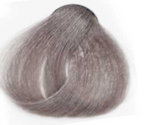
9/11 Intensive Very Light Smoky Blonde بلوند دودی قوی خیلی روشن