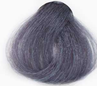
S4 Alizarin Blue آبی آلیزارین