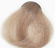
8/31 Light Beige Blonde بلوند بژ روشن