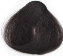
6/11 Intensive Dark Smoky Blonde بلوند دودی قوی تیره