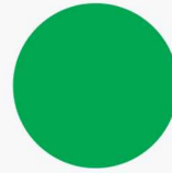
0/88 Green واریاسیون سبز