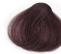
6/01 Dark Ash Blonde بلوند خاکستری تیره