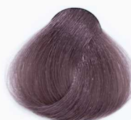
CS3 Espresso لایت اسپرسو