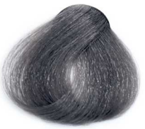
8/1 Light Smoky Blonde بلوند دودی روشن