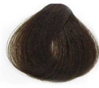
3/8 Dark Matt Brown قهوه ای زیتونی تیره