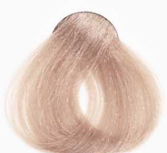
CS7 Biscuit بیسکوییتی