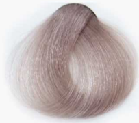
11/11 Smoky Super Platinum سوپر پلاتینه دودی