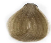
8/8 Light Matt Blonde بلوند زیتونی روشن