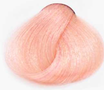
PF Pink Flamingo فلامینگو