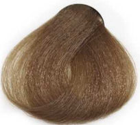
7/003 Medium Warm Natural Blonde بلوند طبیعی گرم متوسط