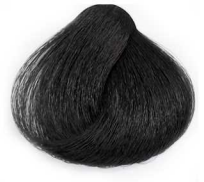
5/1 Light Smoky Brown قهوه ای دودی روشن