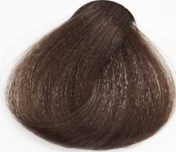
5/7 Light Chocolate Brown قهوه ای شکلاتی تیره