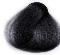
6/1 Dark Smoky Blonde بلوند دودی تیره