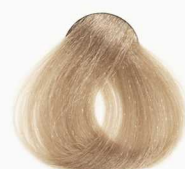
CS6 Nescafe Milk شیر نسکافه