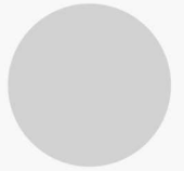
0/10 Silver واریاسیون نقره ای