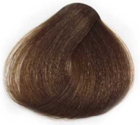
6/003 Dark Warm Natural Blonde بلوند طبیعی گرم تیره