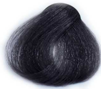
7/1 Medium Smoky Blonde بلوند دودی متوسط