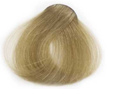
9/8 Very Light Matt Blonde بلوند زیتونی خیلی روشن