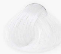
000 Clear روشن کننده خفنی