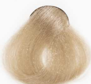
CS2 Caramel کاراملی