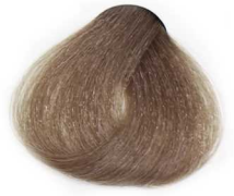
7/0 Medium Blonde بلوند متوسط