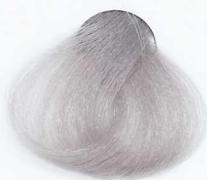
9/21 Very Light Pearl Blonde بلوند مرواریدی خیلی روشن