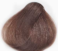
6/31 Dark Beige Blonde بلوند بژ تیره