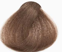
7/23 Medium Aprikat Blonde بلوند آپریکات متوسط