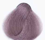
CS4 Toffee تافی