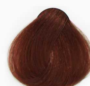
6/4 Dark Copper Blonde بلوند مسی تیره