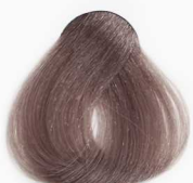
CS5 Chocolate Milk شیر شکلات