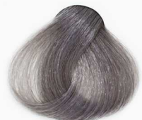
S2 Lead سربی