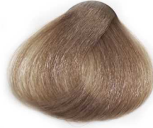
8/0 Light Blonde بلوند روشن