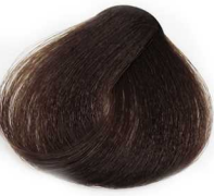
4/0 medium Brown قهوه ای متوسط