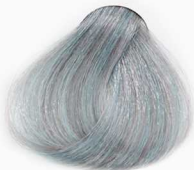
S1 Blue Silver نقرآبی