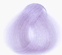
920 Violet Platinum Blonde یاسی