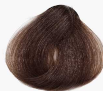
5/75 Light Chestnut Brown قهوه ای فندقی روشن