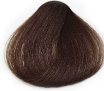
5/0 Light Brown قهوه ای روشن