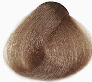
7/3 Medium Golden Blonde بلوند طلایی متوسط