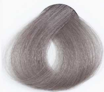
8/21 Light Pearl Blonde بلوند مرواریدی روشن