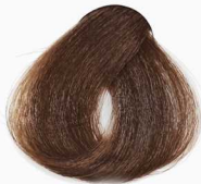
6/3 Dark Golden Blonde بلوند طلایی تیره