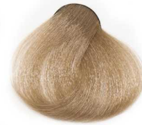
9/003 Very Light Warm Natural Blonde بلوند طبیعی گرم خیلی روشن