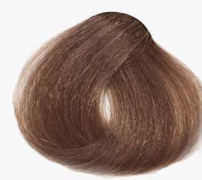
6/75 Dark Chestnut Blonde بلوند فندقی تیره