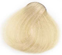
10/8 Platinum Matt Blonde بلوند زیتونی پلاتینه