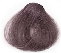
7/01 Medium Ash Blonde بلوند خاکستری متوسط