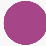
0/22 Violet واریاسیون بنفش