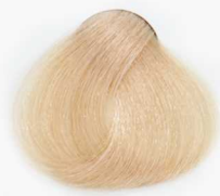
900 Special Natural Blonde بلوند طبیعی فوق العاده روشن