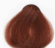
8/4 Light Copper Blonde بلوند مسی روشن