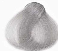
S3 Silver نقره ای