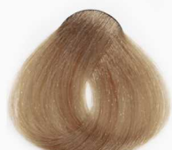
CS1 Nescafe نسکافه ای