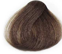
6/0 Dark Blonde بلوند تیره